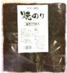
2039 焼きのり 全型20枚 1164円(税込) 15円引