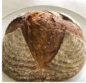
ハーフカットサイズ