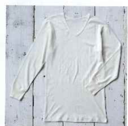
■紳士長袖Vネックシャツ

●サイズ/M:身丈72cm, 袖丈35cm, 肩幅40cm L:身丈78cm, 袖丈36cm, 肩幅42cm