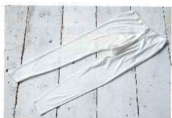
■婦人スラックス下

●サイズ/M:ウエスト82cm, 股下55cm L:ウエスト88cm, 股下61cm