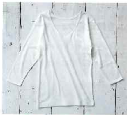
■婦人8分袖インナー

●サイズ/M:身丈52cm, 袖丈42cm, 肩幅30cm L:身丈64cm, 袖丈43cm, 肩幅38cm