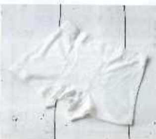
■紳士ニットトランクス