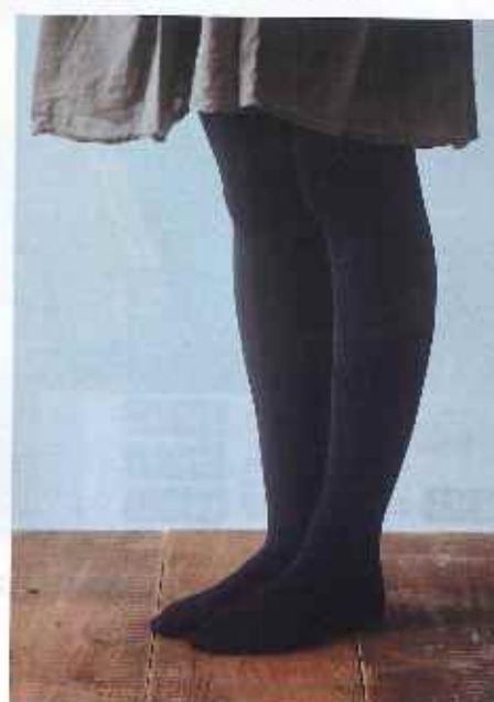
■スパンシルク中厚タイツ