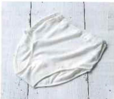
■婦人深型ショーツ