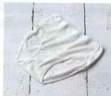
■婦人スタンダードショーツ