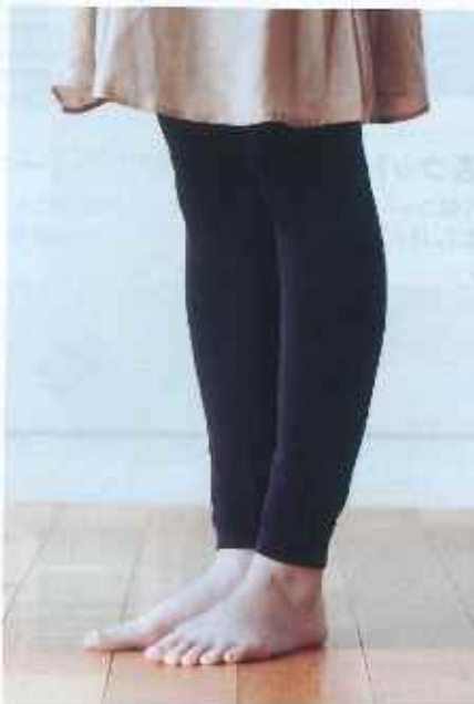
■スパンシルク中厚ロングスパッツ

●素材/シルク(絹紡糸)60%-ナイロン35%-ポリランタン4% ●サイズ M-L:身丈30~35cm, トップ90~96cm (ヒップ裏マチ付) JM-L:身丈30~35cm, ヒップ96~113cm (前後両マチ付) ●縫製/底縫:縫製(ネット)