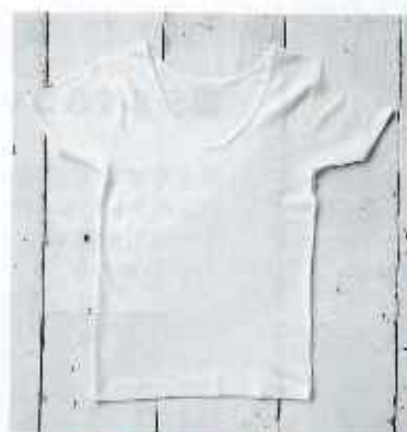
■婦人3分袖インナー

●サイズ/M:身丈52cm, 袖丈15cm, 肩幅30cm L:身丈64cm, 袖丈16.5cm, 肩幅38cm