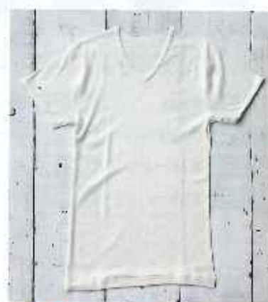
■紳士半袖Vネックシャツ

●サイズ/M:身丈72cm, 袖丈15cm, 肩幅40cm L:身丈78cm, 袖丈16cm, 肩幅44cm