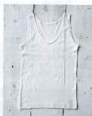
■婦人ノースリーブ