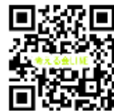
①100円以上お買上げでLINE

※ご注文の締切りは、★火曜コース⇒木曜日のAM10時まで ★金曜コース⇒月曜日のAM10時まで ※土曜日と日曜日は休業日となります。