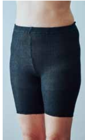
ウエストゴム穴あり

ライプコットンのシルクニットは絹紡糸と絹紡糸からできています。絹紡糸とは生糸を採りだした後の繭や製糸工程で発生する副産物から紡績された糸で、比較的短い繊維から成り、自然で素朴な風合いを感じさせる絹糸です。これに絹紡糸(スパンシルク)を合わせ、独特の肌触りと温かさを実現しました。伸縮性があり身体にフィットするシルクニットです。