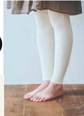
ウエストゴム穴あり