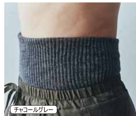
チャコールグレー