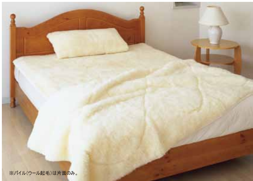
※パイル(ウール起毛)は片面のみ。

天然繊維100%の毛足の長い羊毛で、身体を自然なあたたかさでやさしく包んでくれるメリノンの毛布。寒い冬でも掛け毛布、敷き毛布セットで使えばよりあたたかく、深い眠りにつくことができます。体温であたたまった空気を逃がさず、朝まであたたかさが持続し、更に抜群の保湿力でお肌を乾燥から守ってくれます。寒さで夜中に何度も目が覚めてしまう方、冬の乾燥が気になる方、睡眠の質を上げたい方におすすめです。