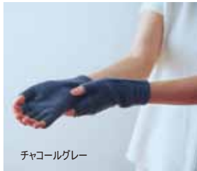
チャコールグレー

素材 / シルク(絹紡糸)42%・ウール46%・ナイロン9%・合成ゴム2%・ポリウレタン1% サイズ / 手囲い:20cm、手首から中指先までの長さ:約18cm 洗濯 / 洗濯機(ネット)