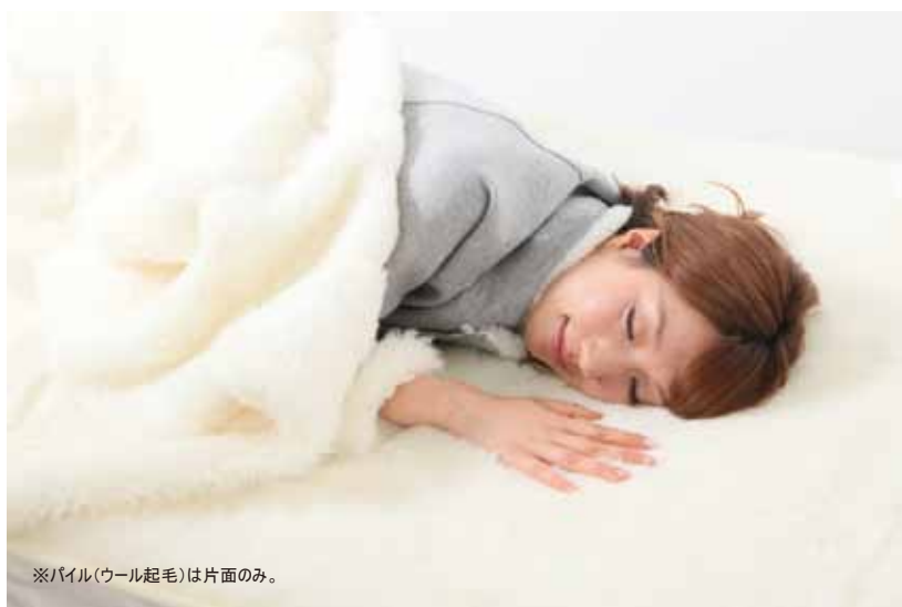
※パイル(ウール起毛)は片面のみ。