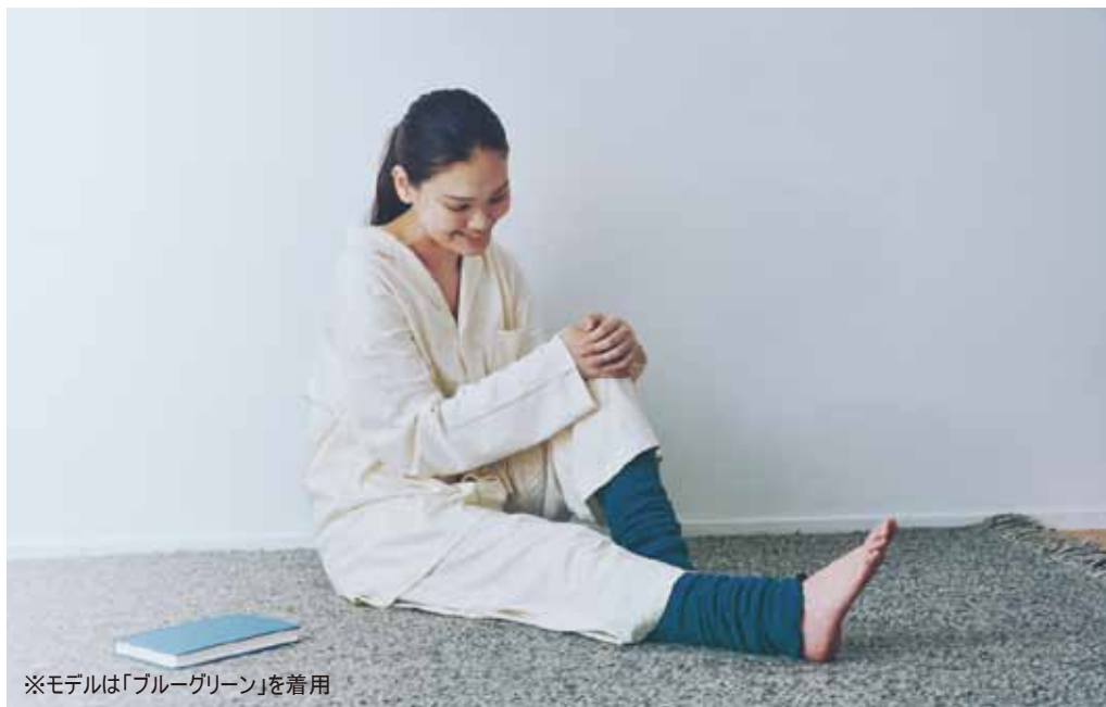
※モデルは「ブルーグリーン」を着用