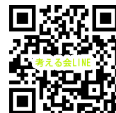
いのちと土を考える会 LINE

※ご注文の締切りは、★火曜コース⇒木曜日のAM10時まで ★金曜コース⇒月曜日のAM10時まで ※土曜日と日曜日は休業日となります。