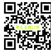
いのちと土を考える会 LINE

※ご注文の締切りは、★火曜コース⇒木曜日のAM10時まで ★金曜コース⇒月曜日のAM10時まで ※土曜日と日曜日は休業日となります。