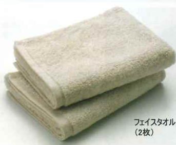
フェイスタオル (2枚)