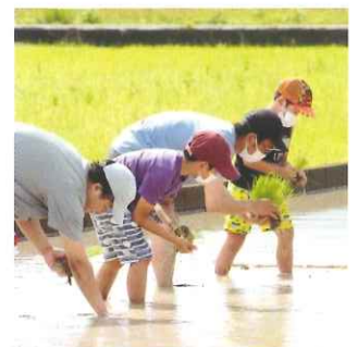
自社農場では、毎年地元ファミリーを招き、 田植えや稲刈の農業体験会を行っています。

不知火海の潮風と日差しをいっぱい浴びた甘夏です。 皮ごと絞った果汁のフレッシュな味わいをお楽しみください。 ※にごりはお酢を造る酢酸菌由来のものです。