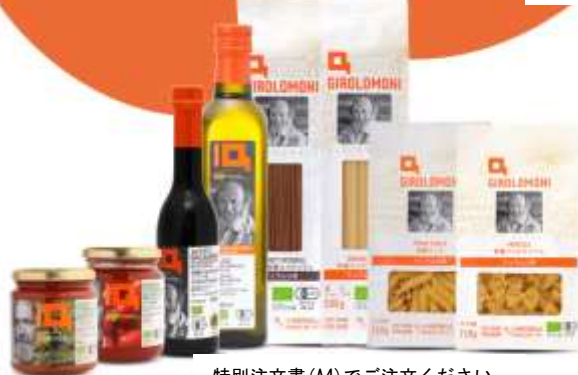
特別注文書 (A4) でご注文ください

今週はパスタ特集です。ジロロモーニのパスタシリーズを中心に、グローバル商品や、いなかもん倶楽部のニンニクの芽ペーストなども特価でのお届けです。