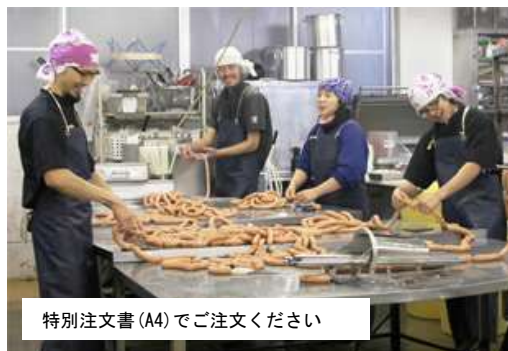
特別注文書 (A4) でご注文ください