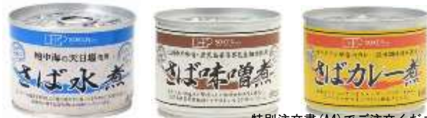
特別注文書 (A4) でご注文ください

西日本で水揚げされた鯖を使用した「さば缶シリーズ」。そのままおかずやおつまみはもちろん、お料理にも美味しくご利用できます。