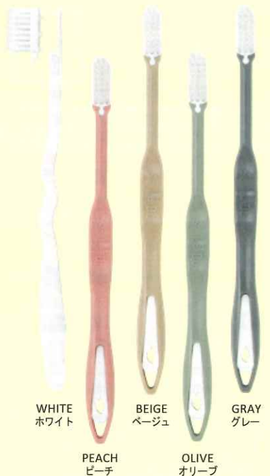
WHITE ホワイト PEACH ピーチ BEIGE ベージュ OLIVE オリーブ GRAY グレー