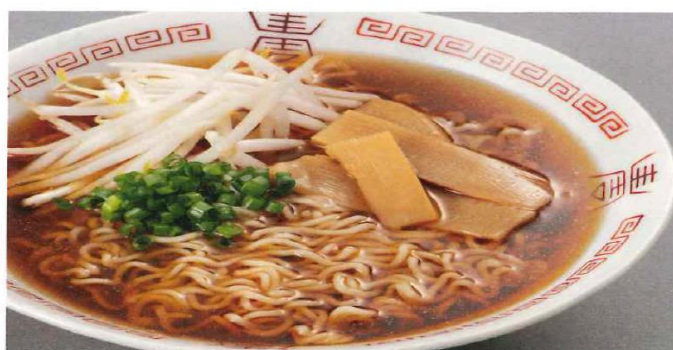
尾道ラーメン・しょうゆ味