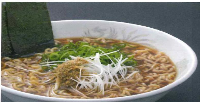
尾道いりこラーメン