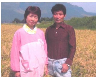
島川さん(阿蘇市)ご夫婦

豚肉は生産者からの一頭買いのため、一頭から多くとれる部位や少ない部位があり、皆さんからの注文量との在庫調整がとても難しい現状があります。現在、ローズの「生姜焼き用」と「トンカツ用」の在庫が沢山あり困っています、どうぞご協力をよろしくお願いいたします。